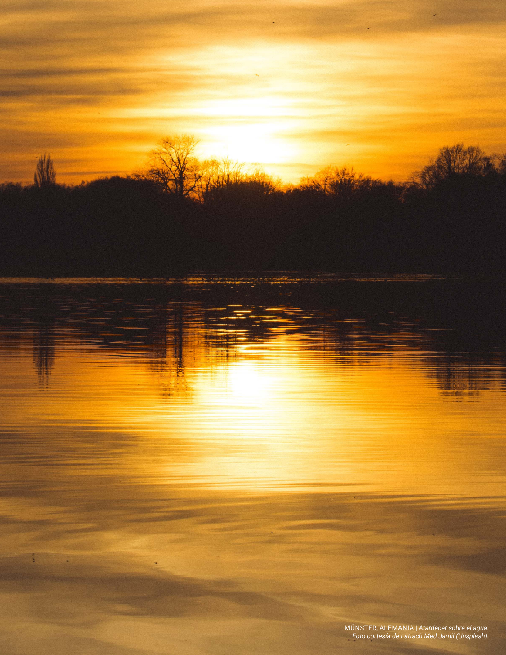
MÜNSTER, ALEMANIA | Atardecer sobre el agua.