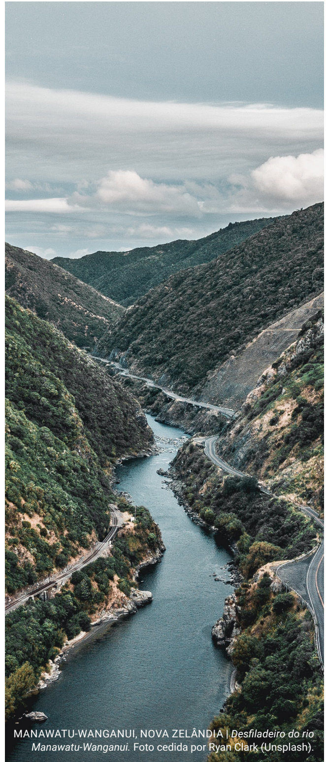
MANAWATU-WANGANUI, NOVA ZELÂNDIA | Desfiladeiro do rio Manawatu-Wanganui.

Em meados de 2017, o Supremo Tribunal da Índia suspendeu as decisões do Supremo Tribunal de Uttarakhand. 25 O governo do estado de Uttarakhand buscou a suspensão alegando que ela criava incerteza jurídica e não prestava contas das questões de federalismo que cercam os rios transfronteiriços. Esses argumentos apresentados pelo estado refletem algumas das limitações de uma abordagem antropocêntrica da “pessoa jurídica”, em comparação com uma abordagem ecocêntrica que vê o rio como um sujeito de direitos.